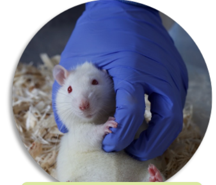
3. Ventraler Kontakt