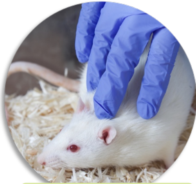
1. Dorsaler Kontakt

Käfig öffnen und Käfigeinrichtung entfernen. Lassen Sie Ihre Hand einige Sekunden im Käfig ruhen, bevor Sie beginnen: