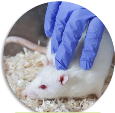
1. Contact dorsal

Placer la cage sur une table. Enlever les objets d'enrichissement de la cage. Placer une main immobile dans la cage pendant quelques secondes avant de procéder avec les manipulations suivantes :